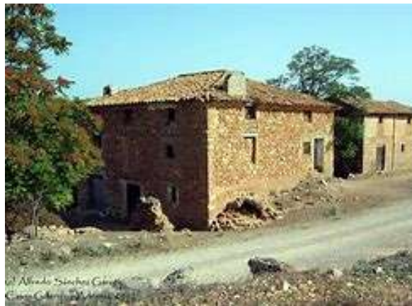
FIGURA 1. Casas de adobe en la montaña de Guerrero

En la mayoría de las comunidades de la montaña, el principal material utilizado para construir las casas es el adobe (ver figura 1), con la estructura del techo de madera y los techos de láminas a dos aguas, en su mayoría de metal, pero también de cartón. En casos raros, los mosaicos han sobrevivido. Mide 5m x 10m con un tabique en el medio para formar dos espacios de 5m x 5m. [1]