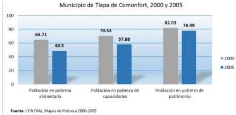
Figura 3. Porcentaje de la población según umbral de pobreza