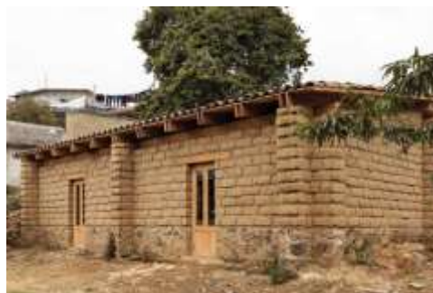
FIGURA 2. Casas de adobe con cimentación

Las casas duraderas son aquellas construidas con materiales duraderos, que garantizan una estructura permanente y suficiente para proteger a los residentes en condiciones climáticas extremas (ver figura 2).